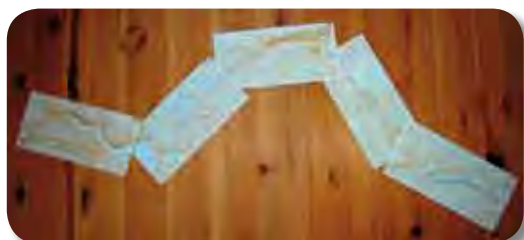
Få oversikt over turen før avreise

Hvert kartblad er en selvstendig enhet med informasjon om avstander, overnatting, severdigheter, transport, servering m.m. For- og baksiden på kartene er vridd 90 grader i forhold til hverandre, slik at du slipper å snu på hodet dersom du har montert kartene i ei plastlomme på styreveska.